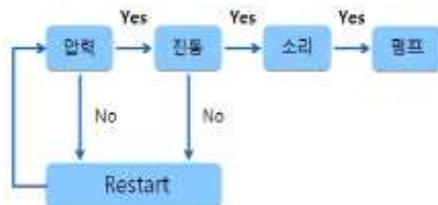
그림 1 시스템 흐름

전원을 통해 사용자가 베개에 누우면 진동 센서와 소리 센서를 차례대로 작동시킨다. 아두이노를 이용하여 코골이 중 발생하는 진동과 소음이 각 센서에 입력이 되면 펌프를 작동시켜 에어백의 크기를 조절한다. 에어백 크기가 변하게 되면 사용자의 목 근육에 자극을 주어 이완된 근육을 수축, 기도를 확보하여 코골이를 멈추게 한다. 코골이가 멈추게 되면 센서에서 소리와 진동을 감지하지 못하고 펌프 작동이 중단된다.